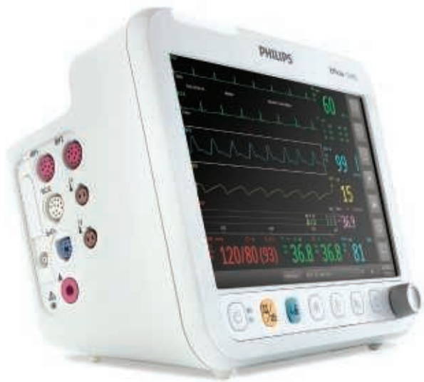
Monitor de paciente Efficia CM10 de Philips

Los monitores Efficia se centran en funciones esenciales de monitorización mediante unas mediciones fisiológicas precisas y fiables.