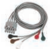
Monitorización de ECG/CO 2 ef