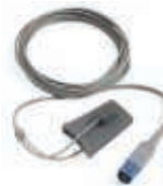
Monitorización de SpO 2 Manguito de PNI