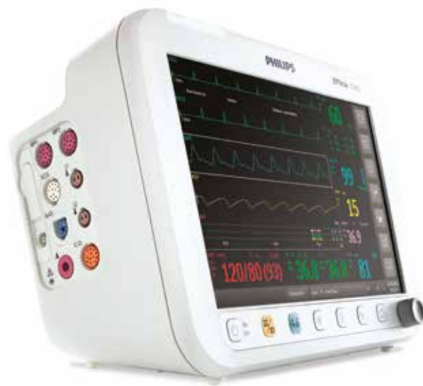
Monitor de pacientes Philips Efficia CM12

Os monitores de pacientes Efficia dão ênfase à funcionalidade do monitoramento com as medições fisiológicas comprovadamente apuradas e confiáveis da Philips.